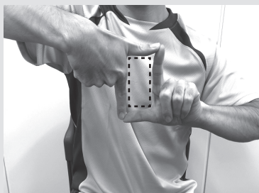
1)両手の親指と人差し指でL字を作り、左右の手を入れ替えながら四角形を作ります。

nagomiの運動に「脳活性化プログラム」が加わりました!認知症状の緩和や予防に繋がっていきましょう!