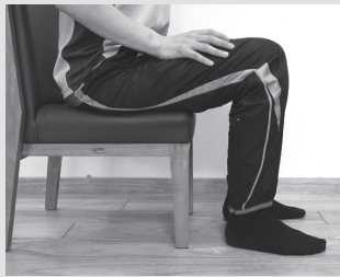
1)つま先を軸に踵の上げ下げを行います。